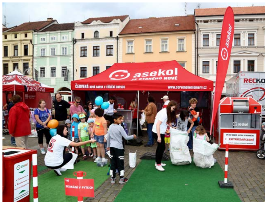
Akce přilákala na česká náměstí velké množství zájemců.