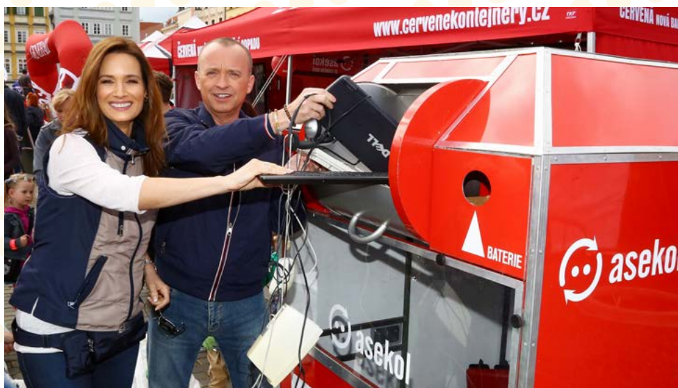
Třídění starého elektra vzaly za své i tváře zpravodajství TV Prima.

Tři z nich, která měla na konci roadshow největší počet kilogramů odevzdaného elektra na obyvatele, pak obdržela od společnosti ASEKOL šek v hodnotě 30, 20 a 10 tisíc Kč na charitativní účely. Nejlepšího poměru množství vytříděného vysloužilého elektrozařízení na jednoho obyvatele dosáhl Mělník, který jen těsně předběhl druhý Tábor. Na třetím místě skončila Plzeň. Podrobnější informace naleznete na webu www.korunazakilo.cz .