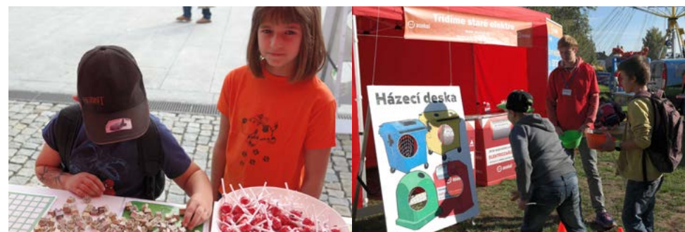
Pro malé návštěvníky obou akcí byla připravena řada zábavných atrakcí.

Obou akcí se zúčastnili především nejmenší obyvatelé zmiňovaných měst z tamních základních a mateřských škol, pro něž byly připraveny soutěže zaměřené na třídění elektrozařízení. Malí i velcí návštěvníci infostánku se mohli nenásilnou a hravou formou vzdělat v oblasti recyklace starého elektrického. Připraven pro ně byl mimo jiné zábavný kvíz, hra využívající klávesy z vysloužilých počítačových klávesnic nebo házečí deska. Všichni účastníci, jichž se na obou akcích sešlo více než dvě tisíce, získali drobné odměny.