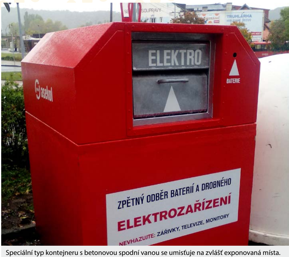
Speciální typ kontejneru s betonovou spodní vanou se umísťuje na zvláště exponovaná místa.

Díky tomu, že hlasování je zpoplatněné, mohou navrhovatelé vybrané finance v následujícím roce využít například na zajištění ošetření stromu, výsadbu nových stromů v okolí, umístění drobného mobiliáře v blízkosti stromu nebo místní informační kampaň o stromech.